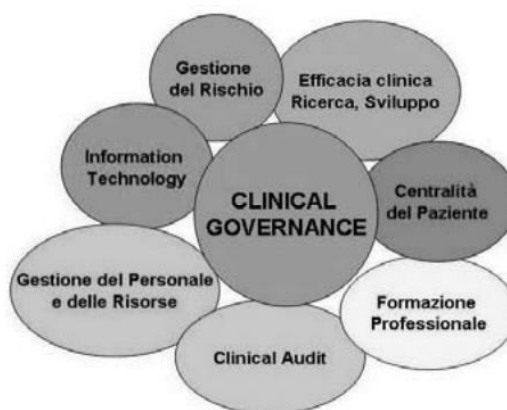
Componenti della CLINICAL GOVERNANCE